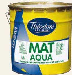
MAT AQUA IDEM