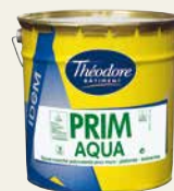
Prim aqua idem*