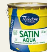
Satin aqua idem*