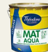
Mat aqua idem*