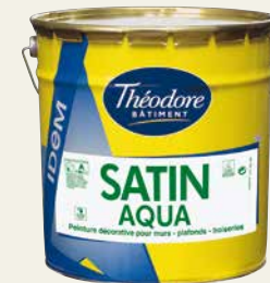
SATIN AQUA IDEM