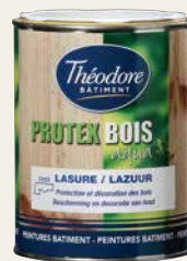
PROTEX BOIS AQUA LASURE