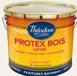
PROTEX BOIS SATIN