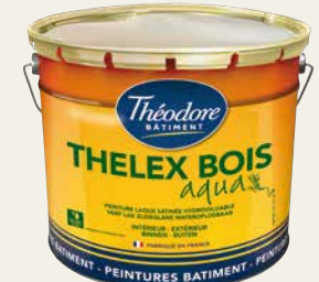
THELEX BOIS AQUA