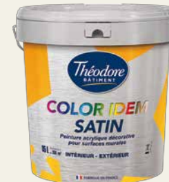
IDEM SATIN ACRYL