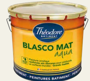
BLASCO MAT AQUA