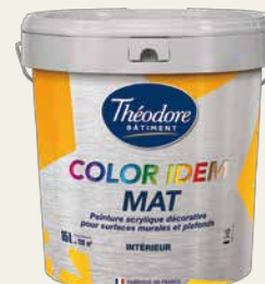
IDEM MAT COLOR